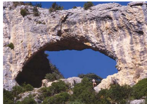
Formación en arco.