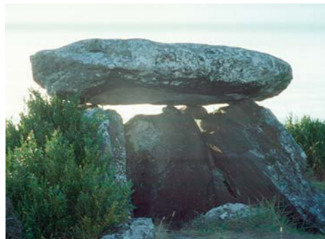
Dolmen de Guara.

En el Prepirineo , y al Norte de la Hoya de Huesca y del Somontano de Barbastro , se ubica la Sierra de Guara. Su estratégica situación, entre las estepas del Ebro y los Pirineos, encrucijada climática entre lo atlántico y lo mediterráneo , se traduce en una marcada diferencia entre la vegetación de las vertientes Norte y Sur, y en la aparición de numerosas especies exclusivas de estas sierras.