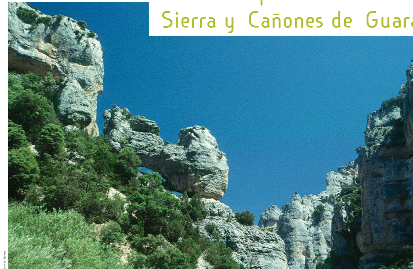
Sierra de Guara, el zapato.