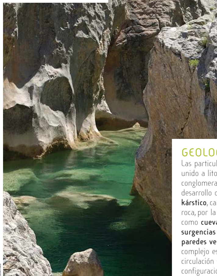
Barranco de Guara.