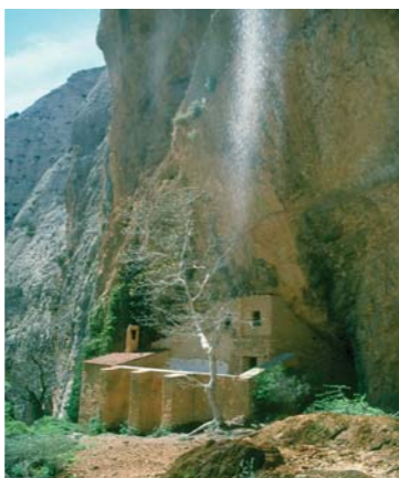
San Martín de la Val d'Onsera.

Las particulares condiciones climáticas, unido a litologías calizas y a los conglomerados, han favorecido el desarrollo de un complejo sistema kárstico , caracterizado, al disolverse la roca, por la aparición de formaciones como cuevas, simas, galerías, dolinas, surgencias y manantiales , e imponentes paredes verticales y mallos . Dicho complejo está íntimamente ligado a la circulación subterránea del agua y a la configuración de gargantas y barrancos .